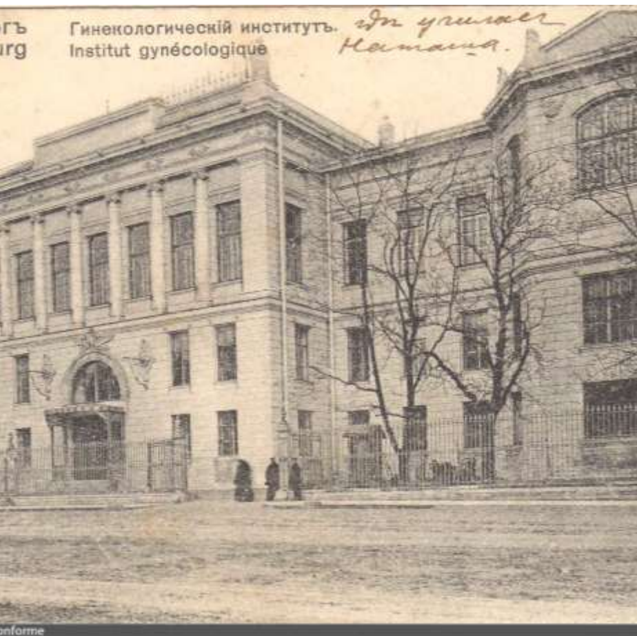
Первый Женский Повивальный институт, Санкт-Петербург

В середине XVIII века в России появились специальные учреждения для подготовки повитух: «Повивальные институты» и «Повивальные школы». В XIX веке стали появляться акушерские кафедры при университетах. Первый же родильный госпиталь был открыт в 1764 году при московском воспитательном доме.