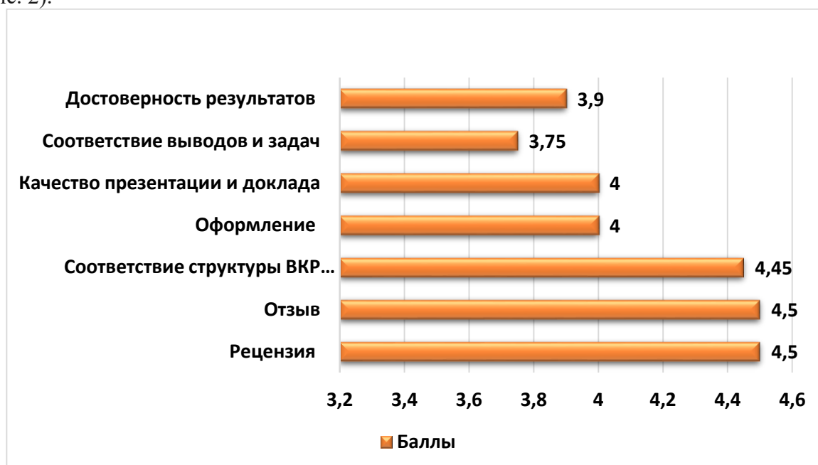
Рисунок 2 - Результаты ГИА выпускников по отдельным критериям, в баллах

Также, анализ результатов ГИА выпускников по отдельным критериям оценочного листа показал, что наиболее высокие баллы были поставлены в отзывах и рецензиях на дипломную работу, наиболее низкие баллы получены по критериям «Соответствие выводов, поставленным задачам и соответствие содержания работы содержанию профессионального модуля», «Достоверность результатов и степень самостоятельности» (см. рис. 2).